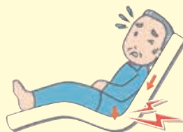
下方方向にずれている

初期型ポケットは、深い褥瘡が発生した際に生じる厚い壊死組織が時間経過と共に自己融解し、排出された後にできるものです。